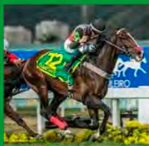
1º GP BRASIL – G1