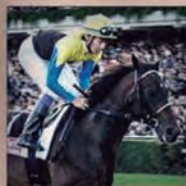
442KG (3RD) DEEP IMPACT