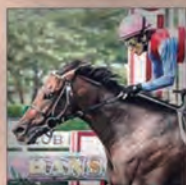
462KG (2ND) NAKAYAMA FESTA