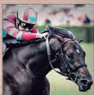
478KG (4TH) KIZUNA