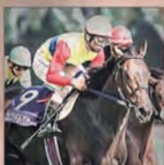
470KG (2ND) EL CONDOR PASA