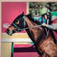
446KG (TBD) THROUGH SEVEN SEAS