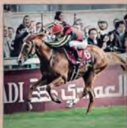
456KG (2ND) ORFEVRE